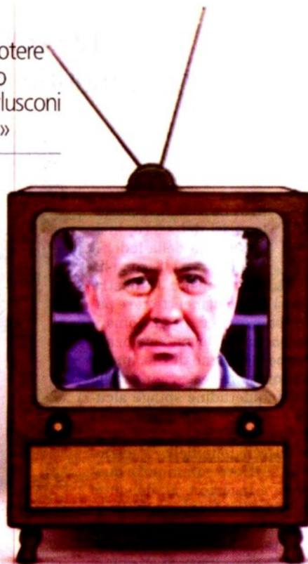
Frame del video con un Berlusconi a fumetti nel lancio sul web di Servizio pubblico