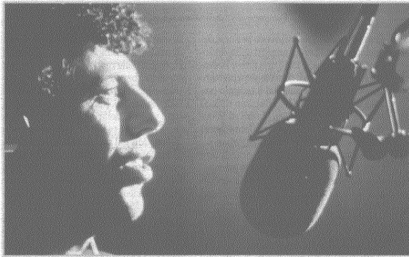
Eric Bogosian, protagonista del film di Oliver Stone «Talk Radio»