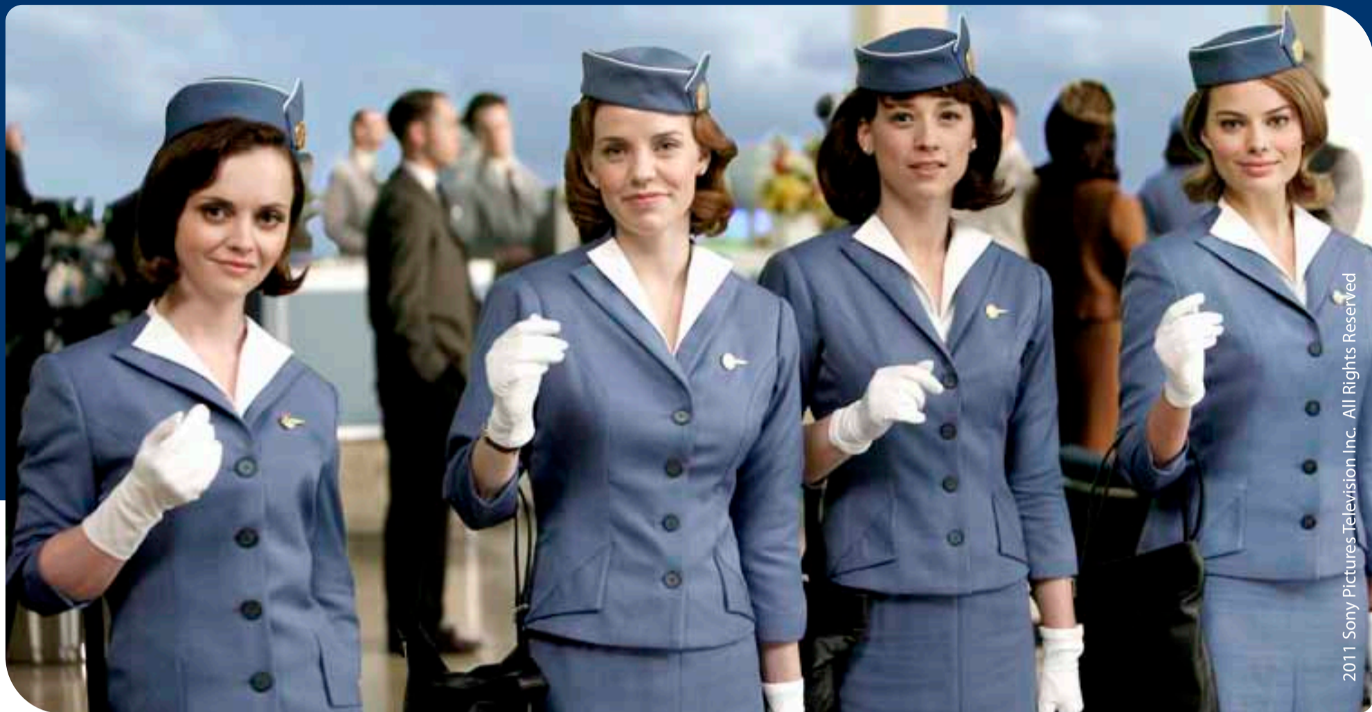
2011 Sony Pictures Television Inc. All Rights Reserved